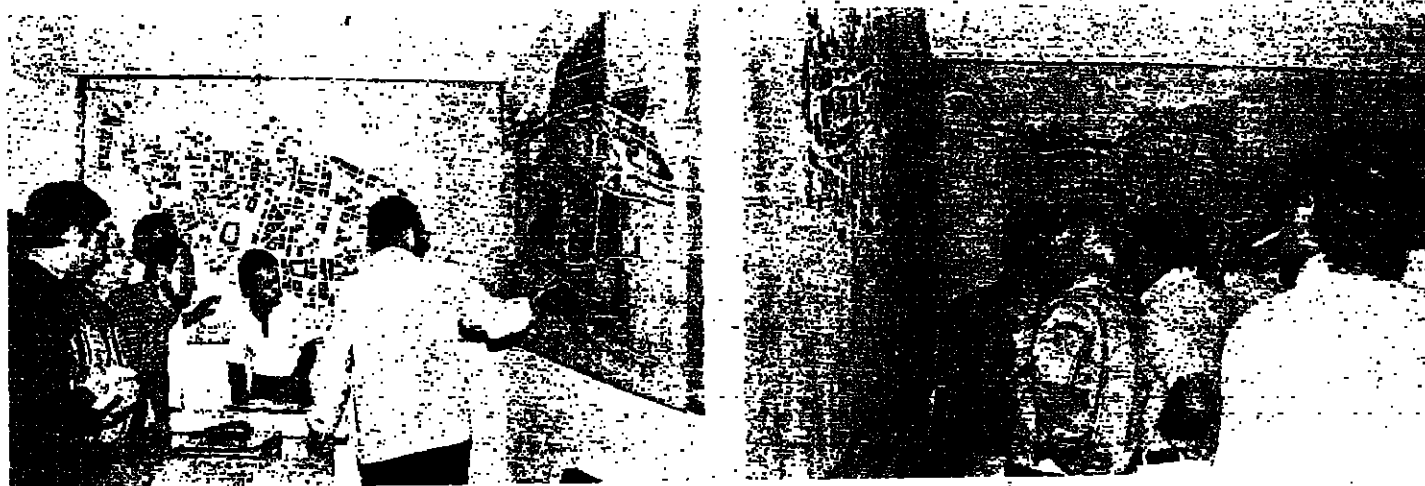
تجار يراقبون خرائط الاسواق لغرفة مصر حلاهم

تأهلت اللجنة التنفيذية لمجلس الاساتذة في الكليات والمعاهد المستحثة اجتماعاتها امس مع مندوبي الاساتذة في الكليات ، وعرضت التطورات المستجدة حول قضية الجامعة اللبنانية ونقشت مواقف بعض السيمينس والقواب والمتمنين بشؤون الجامعة اللبنانية ، فالتقت على مواقفهم البعض من ايد اقتاعات المنداء والاساتذة والطالبات في الكليات المستحثة ، وادانت ممارسات الذين شوهوا مفهوم الجامعة اللبنانية المستقبلي . وخلال الاجتماع عرض رئيس اللجنة التنفيذية على لجنتي الجامعة التقنيين من مجلس المنداء والاحزاب اللبنانية الخطة التي اقترحتها مجلس الاساتذة ، والتي مستندة خلال الايام المقبلة ، ومنها الاجتماع الذي يقود اليوم الجمعة الساعة التاسعة صباحا مع رئيس المحكمة الدكتور سليم الحص في السراي .